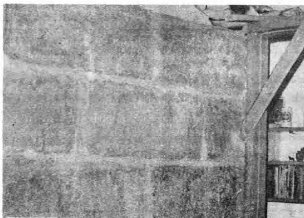
FIGURA 2. Pared levantada con bloques de madera-cemento.