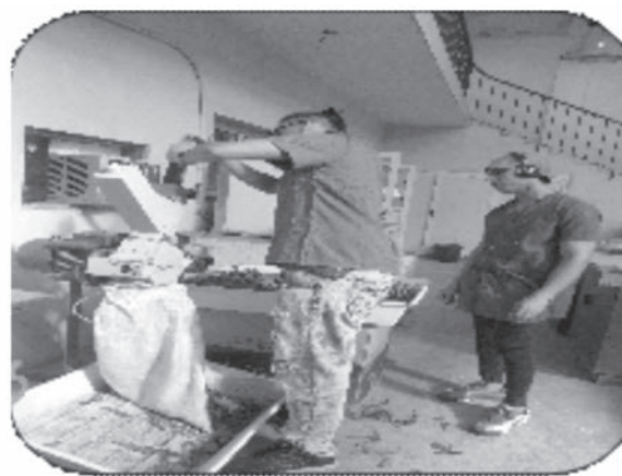
Figura 2. Proceso de molinado.

La extracción del aceite esencial se realizó por el método de arrastre por vapor a escala de banco en un equipo existente en el laboratorio de Fitoquímica del Instituto de Investigaciones