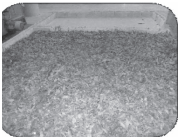
Figura 1. Secado natural del follaje.

El follaje recolectado de arbolitos juveniles es de aproximadamente un año de edad. Una vez talados, se procedió al desrame, y finalmente se separaron las hojas de los raquis. El proceso se realizó de forma manual en el campo. El follaje fue transportado en sacos de nailon de aproximadamente 10 kg de peso y se depositaron en la nave de tecnología del Instituto de Investigaciones Agro-Forestales (INAF), donde se colocaron para su secado natural a la sombra, en un área delimitada, distribuidas uniformemente, logrando una capa no superior a 10 cm, por un espacio entre 12 y 15 días, removiendo diariamente (dos veces) estas capas para facilitar la aireación en el período de secado ( Fig. 1 ). Posteriormente se trituraron en un molino de cuchilla (Retsech SM 100) a un tamaño de partícula \leq 20 mm ( Fig. 2 ).