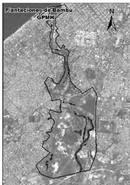
Figura 1. Imagen satelital de La Habana y límites del GPMH, con la FFH de la zona sur.

El trabajo se desarrolló en la FFH de la zona sur del GPMH, que se localiza en la región occidental de Cuba, provincia de La Habana ( Fig. 1 ).