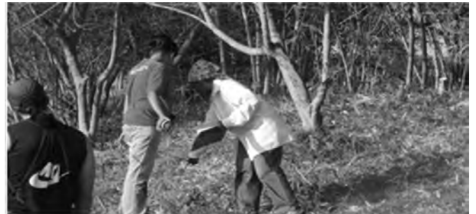
Figura 2. Primeras hileras de la FFH la subfamilia Bambusoideae. Filas intermedias con Hura crepitans L. (salvadera) y L. leucocephala (Lam.) de Wit. subsp. leucocephala (ipil-ipil)

Como resultado del inventario realizado en la FFH de la zona sur del GPMH, se identificó una riqueza (S) de 30 especies leñosas distribuidas en 25 géneros y 15 familias botánicas, siendo mayoritaria B. vulgaris var. vulgaris (Fig. 2), lo cual confirma lo planteado por Bianchi et al. (2007) y Valiente (2012): «El 50 % de las plantaciones de bambú establecidas en ambas márgenes del río principal, afluentes y áreas colectoras hacia los cuerpos de agua del GPMH, corresponden a las primeras hileras de la FFH. Estas plantaciones están asociadas con otras especies forestales que se han establecido artificialmente en las filas intermedias y exteriores de dicha faja».