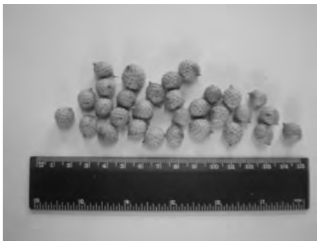
Figura 2. Frutos de C. tetradactylus .

Los frutos maduros tienen forma redondeada con un pequeño pico, y cubiertos por 21-23 hileras verticales de escamas blanco-amarillentas. Generalmente tienen una semilla, de forma globosa y con el embrión en la base (Fig. 2).