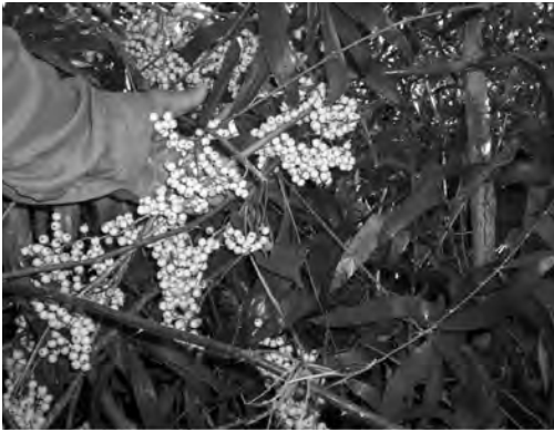
Figura 1. Racimo de frutos de C. tetradactylus en completo estado de maduración.

En la primera floración no ocurrió la fecundación de las flores femeninas, por lo que no se obtuvieron frutos hasta dos años después, en agosto, a los seis años de plantadas en que se observó la completa maduración de estos (Fig. 1).