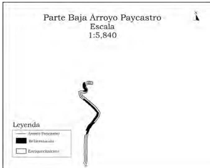
Tramo 1. Finca de Noel Góngora a la de Wice García.

estudio de habilidades competitivas y categorías funcionales de las especies. La compartimentación que sirvió de base a los estudios se expone a continuación: