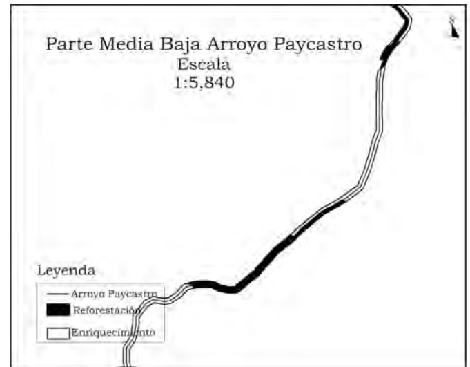
Tramo 2. Wice García a Corralillo. Corralillo.