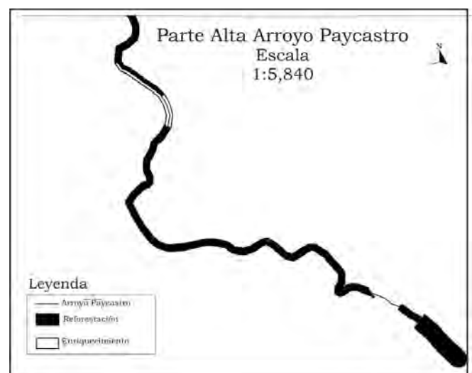
Tramo 4. Convento a la desembocadura.