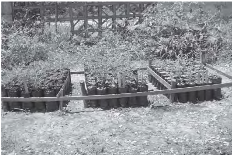
Figura 4. Vivero de Parmentiera edulis D.C. En suelo I (izquierda), el mejor comportamiento, seguido de suelo II, y suelo III el de menor desarrollo de las plantas.