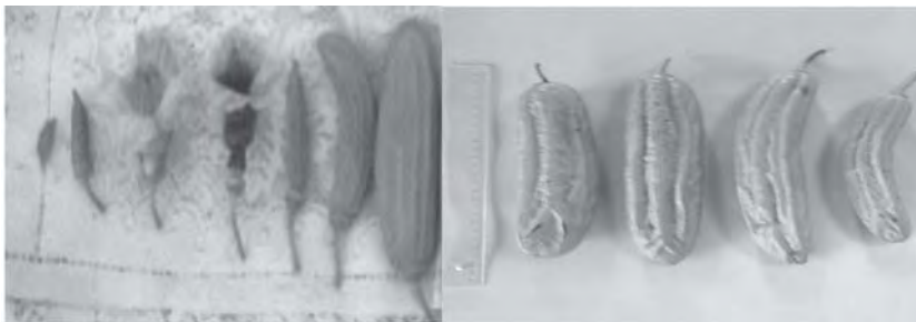
Figura 2. Características de la flor y los frutos de Parmentiera edulis D.C.

Los frutos en diferentes fases de desarrollo y las flores se muestran en la Fig 2. El peso promedio del fruto maduro oscila entre 130 y 200 g, según los sitios, y son rectos o curvos, siempre estriados, sésiles o colgantes de las ramas.