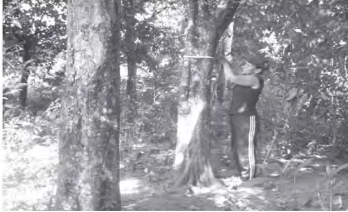
Figura 3. Plantación de cuarenta años en la vega de Caridad Valdés Ramos, cerca del río Mantua.

270 000 semillas, y que son necesarios 640 frutos de 150 g para obtener un kilogramo de semilla limpia.