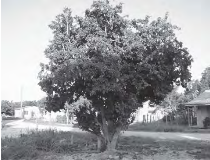
Figura. 1. Árbol de Parmentiera edulis D.C. en área suburbana de Tamarindo, provincia de Ciego de Ávila, en suelo pardo sobre serpentina.