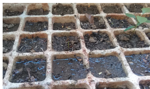
Figura 1. Bandeja de germinación.

La siembra se realizó de forma manual en dos bandejas de poliestireno, cada una con 70 alvéolos, con un total de 140 unidades. Con la ayuda de un espeque, se preparó un hoyo de 1 cm de profundidad en el centro de cada alvéolo. En cada hoyo se colocó un fruto en posición vertical, asegurando las condiciones óptimas para su germinación (Figura 1). A los 120 días de germinadas, las plántulas se trasplantaron a bolsas de polietileno de 10 cm de longitud.