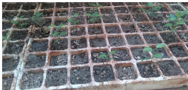
Figura 4. Brotación de las plántulas Fraxinus caroliniana Mill. subsp. cubensis .