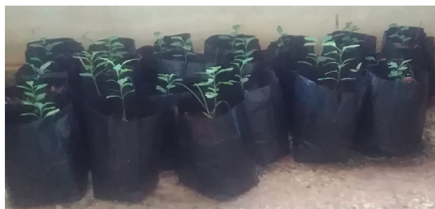
Figura 5. Plántulas trasplantadas después de 60 días de germinadas.

el sustrato. Además, estos autores señalaron que la altura de las plantas es una característica varietal que depende de la interacción entre el genotipo y el ambiente. Estos factores explican las variaciones observadas en el desarrollo de las plántulas.